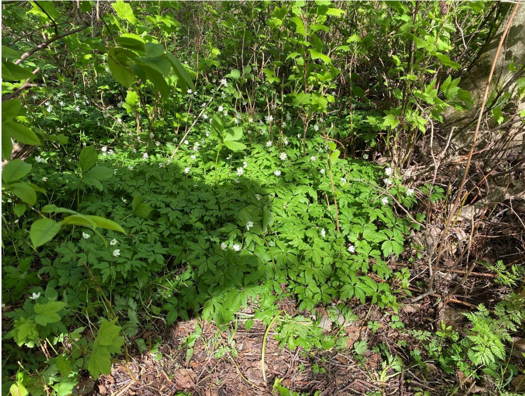
Kuva 4 Suurin yksittäinen kasvusto.

Vauhtipuiston takana noin 15 metrin matkalla on useita kasvustoja, joista suurin on esitetty kuvassa 4. Lähimmät yksilöt ovat pyörätien pientareella. Alue on tuomilehtoa ja tuomia onkin alueella puina ja pensaina. Siellä kasvaa myös harmaaleppiä sekä kookas mänty, jota voi pitää kasvuston keskuksena. Aluskasvillisuudessa kasvava vadelmapensaikko ( Rubus idaeus ), punaherukka ( Ribes ) ja nokkonen ( Urtica dioica ), jotka peittävät vuokot kesällä. Lisäksi sudenmarjaa ( Paris quadrifolia ) on runsaasti. Sudenmarja on vaateliaan lehdon tyyppilaji.