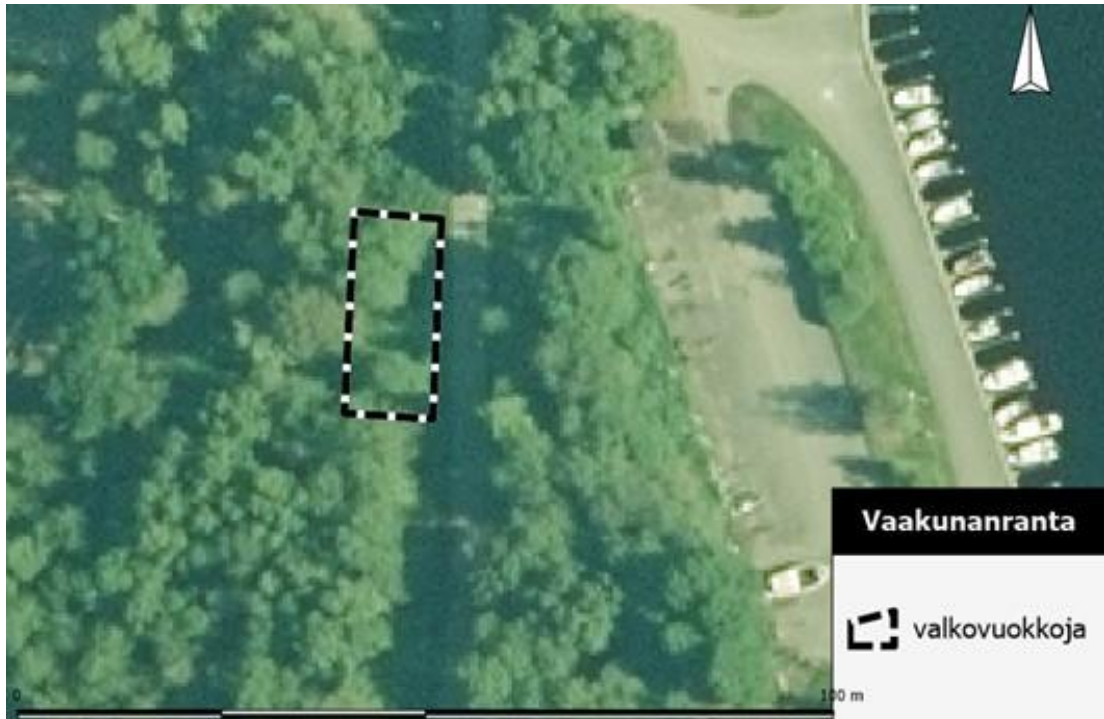
Kuva 2. Valkovuokkoesiintymän sijainti.