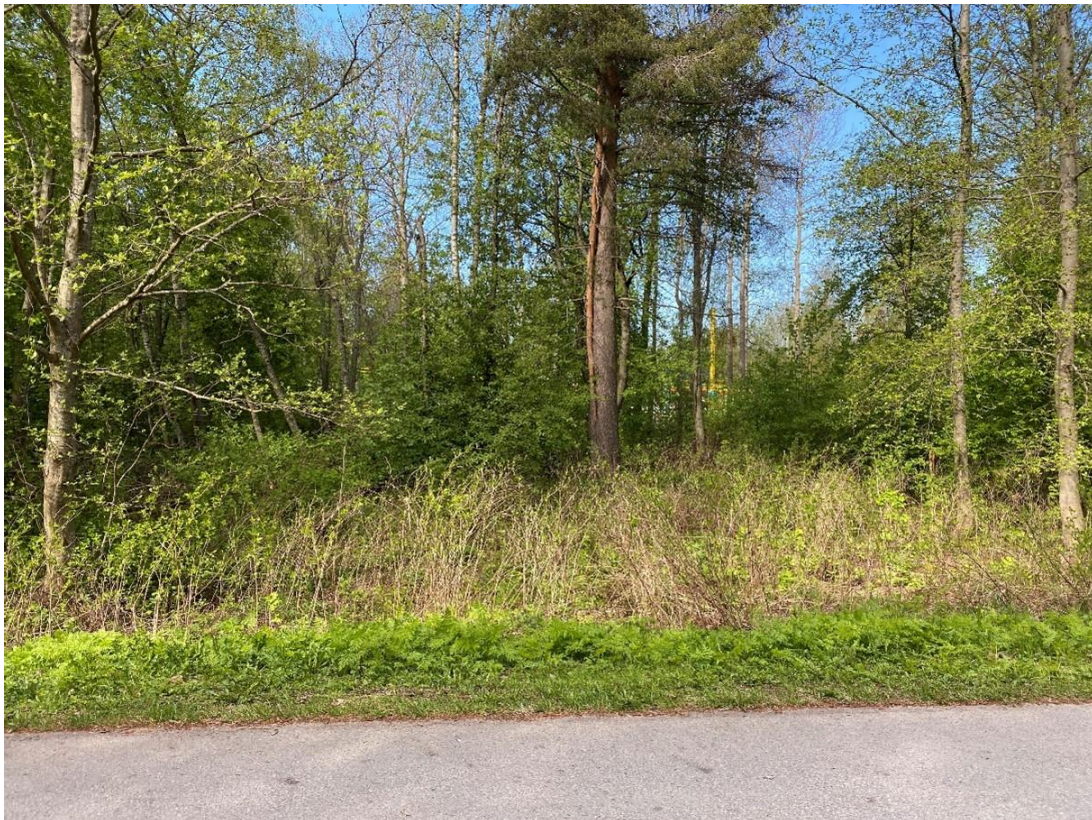
Kuva 3. Valkovuokkojen esiintymispaikka on kookkaan männyn kahta puolen.